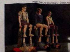
Les six artistes fraîchement sortis de l'école de cirque du Québec.

« Léger démêlé ». Une histoire drôle et grinçante qui parle « d'amitié, de vie en collectif, dans lequel six individus se portent, se supportent, s'envoient des claques... Nous mêlons plusieurs disciplines du cirque, dont certaines peu communes comme les jeux icariens ». Le collectif a présenté son travail au public de la cité du cirque il y a deux