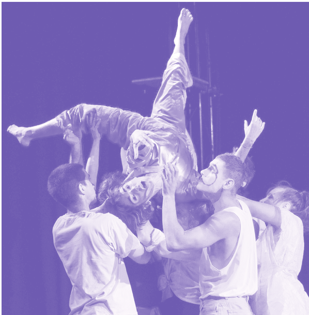
Quoi Q'wang

Durée: 1h15 | Tout public | Gratuit sans réservation