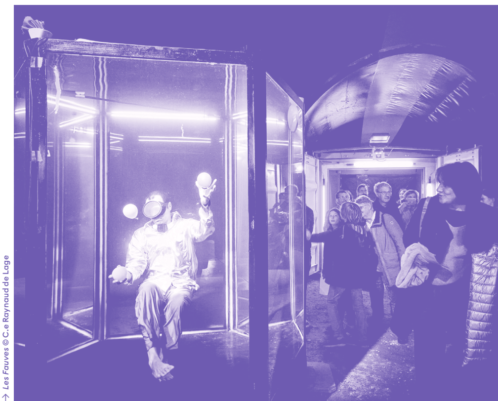
→ Les Fauves

Le Plongeoir – Cité du Cirque est soutenu pour l'ensemble de ses missions par la Ville du Mans, le Conseil départemental de la Sarthe, le Conseil régional des Pays de la Loire et l'État – Direction régionale des Affaires culturelles des Pays de la Loire.