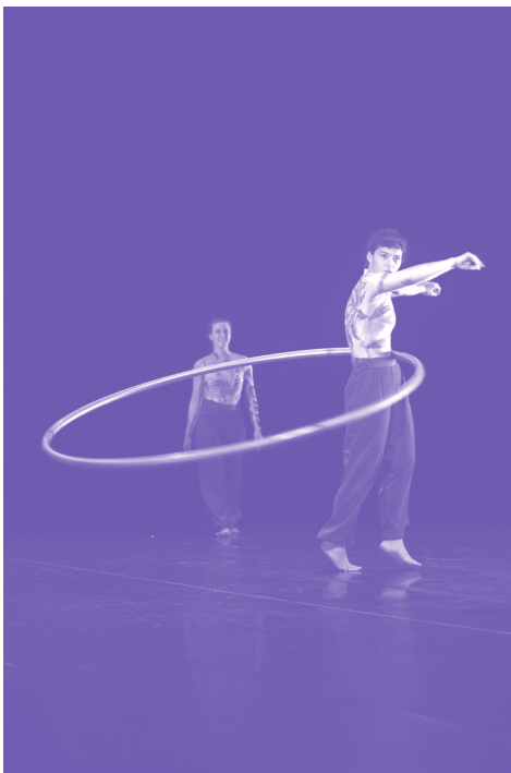
Belles Places

Tout public | Spectacles naturellement accessibles | Gratuit sur réservation