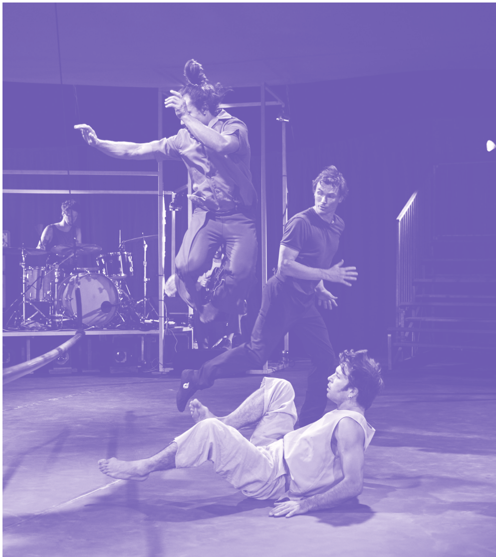
Dans l'espace