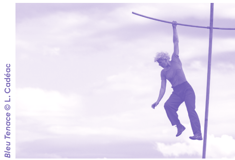
Bleu Tenace

Durée: 30 min | Tout public | Spectacle naturellement accessible | Gratuit sans réservation